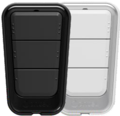
Transmissor TX Stylo