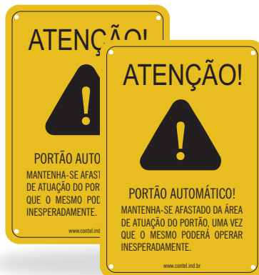
Placa de Alerta